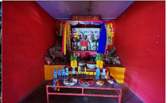
(ภาพศาลพ่อเกาะเต่าหรือที่ชาวท้องถิ่นรู้จักในชื่อศาลพ่อตาเจริญ)