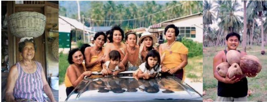
(ภาพรอยยิ้มชาวบ้านเกาะเต่าและวิถีชีวิตคนบนเกาะเต่า)

สุดท้ายนี้ “เกาะเต่าวิถีเล สู่เสน่ห์วัฒนธรรมที่ยั่งยืน” คือการพิสูจน์ว่า การพัฒนาการท่องเที่ยว และการอนุรักษ์วัฒนธรรมสามารถเดินไปพร้อมกันได้ เมื่อเราเคารพอดีต เราจะสร้างอนาคตที่ยั่งยืนได้อย่างแท้จริง