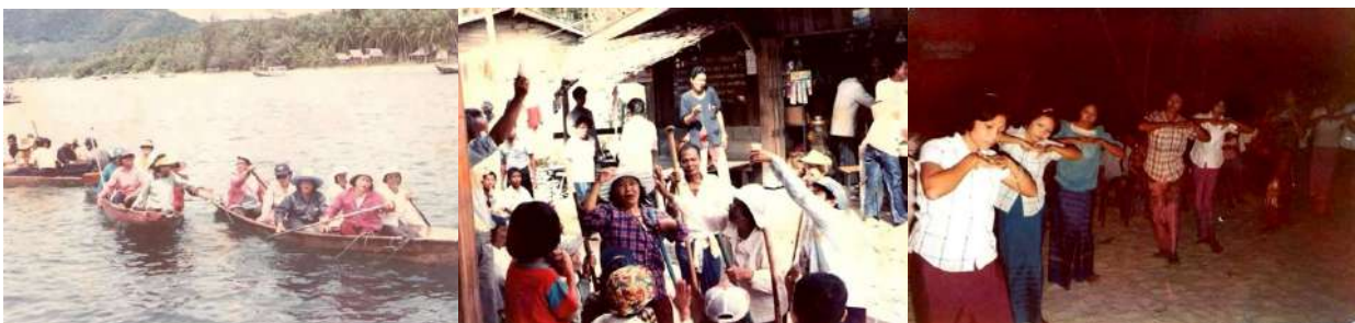
(ภาพภาพประเพณีชักพระทางน้ำ การว่าเพลงบอก ได้ต่อกันระหว่างเรือ ที่เป็นเอกลักษณ์ของชาวเกาะเต่า)

โดยรวมแล้ว การเข้าพรรษาที่เกาะเต่าจะผสมผสานกิจกรรมทางศาสนาที่วัด กับประเพณีวัฒนธรรมท้องถิ่นอย่าง "การชักพระทางทะเล" ซึ่งเป็นเอกลักษณ์ของสุราษฎร์ธานีตอนบน