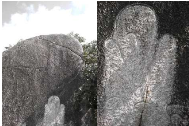
(ภาพจารึกพระปรมาภิไธยย่อ "จ.ป.ร." บนแผ่นหินศิลาแลงขนาดใหญ่ที่ตั้งอยู่บริเวณริมหาดทรายรี ของเกาะเต่า)

เหตุการณ์ประวัติศาสตร์นี้เกิดขึ้นเมื่อวันที่ ๑๘ มิถุนายน ร.ศ. ๑๑๘ (พ.ศ. ๒๔๔๒) พระองค์ทรงนำเรือพระที่นั่งมหาจักรีมาจอดเทียบท่า ณ บริเวณอ่าวแม่หาด และได้เสด็จฯ ขึ้นบกเพื่อทอดพระเนตรสภาพความเป็นอยู่และธรรมชาติอันบริสุทธิ์ของเกาะเต่า ณ บริเวณ หาดทรายรี ซึ่งเป็นหาดทรายขาวละเอียดทอดยาวงดงาม ในการนี้ พระองค์ทรงโปรดเกล้าฯ ให้ จารึกพระปรมาภิไธยย่อ "จ.ป.ร." ลงบนแผ่นหินศิลาแลงขนาดใหญ่ที่ตั้งตระหง่านอยู่ริมชายหาด เพื่อเป็นหมุดหมายแห่งความทรงจำว่า ครั้งหนึ่งสมมติเทพแห่งสยามได้เคยเสด็จมาเยือนดินแดนแห่งนี้