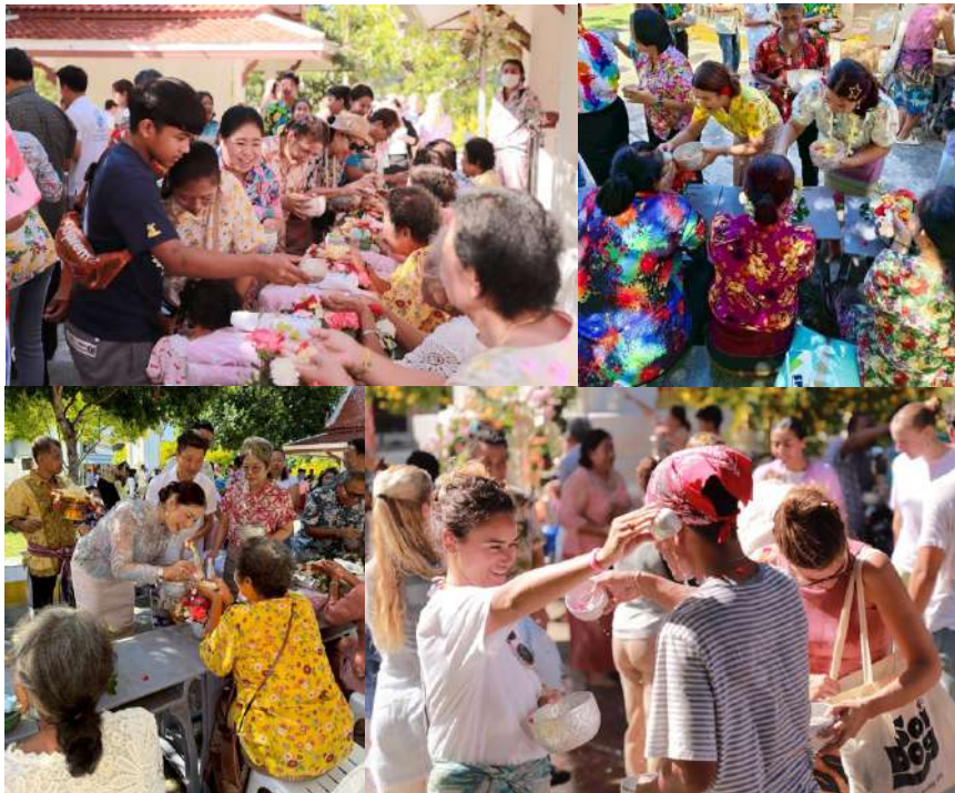
(กิจกรรมรดน้ำดำหัวผู้ใหญ่ เล่นน้ำวันสงกรานต์ วัดเกาะเจริญสันติธรรม)

สงกรานต์จึงมิใช่เพียงมหกรรมสาดน้ำเพื่อคลายร้อน หากแต่คือมรดกทางวัฒนธรรมที่ร้อยรัด "อดีต" จากตำนานเข้ากับ "ปัจจุบัน" ของสถาบันครอบครัว เป็นช่วงเวลาศักดิ์สิทธิ์ที่สายน้ำทำหน้าที่ชำระล้างจิตใจ และเชื่อมโยงสายใยแห่งความเป็นไทยให้ยั่งยืนสืบไป