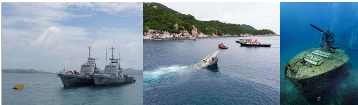
(ภาพเรือหลวงสัตกูด, เรือหลวงหาญหึกศัตรุ และเรือหลวงสุไพรินทร์)

การนำเรือหลวงเก่ามาจมหทะเลเพื่อสร้างเป็นอุทยานการเรียนรู้ใต้ทะเลและแหล่งดำน้ำ ซึ่งเป็นโครงการของกองทัพเรือร่วมกับจังหวัดสุราษฎร์ธานี เพื่อฟื้นฟูระบบนิเวศและส่งเสริมการท่องเที่ยวที่เกาะเต่า โดยกองทัพเรือได้มอบเรือหลวงมาแล้วหลายลำ เช่น เรือหลวงสัตกูด (เป็นแห่งแรก) และเรือหลวงอีก ๒ ลำ คือเรือหลวงหาญหึกศัตรุ และเรือหลวงสุไพรินทร์ (เป็นแห่งที่ ๒ และ ๓ ตามลำดับ) เพื่อเป็นแหล่งอาศัยของสัตว์ทะเลและจุดดำน้ำสำคัญให้นักท่องเที่ยวได้เยี่ยมชม แทนการสร้างประภาคารแบบดั้งเดิมซึ่งประภาคารธรรมชาติ ที่สร้างจากเรือหลวงเหล่านี้ ทำหน้าที่นำทางและเป็นสัญลักษณ์ของการท่องเที่ยวเชิงอนุรักษ์ของเกาะเต่าในยุคปัจจุบัน