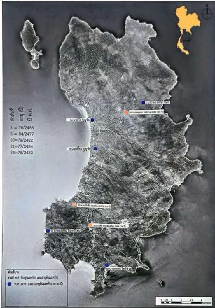
แผนที่แสดงอายุมะพร้าว พืชผลอาสินของราษฎร และเจ้าของสวนมะพร้าว ตำบลเกาะเต่า อำเภอเกาะพะงัน จังหวัดสุราษฎร์ธานี ระหว่างปี พ.ศ. 2470-2485

ที่มา แผนที่ความละเอียดสูงของศูนย์วิจัยข้าวสุราษฎร์ธานี กรมการข้าว/กรมส่งเสริมการเกษตร โดยอาศัยข้อมูลจาก สถาบันพันธุศาสตร์ International Plant Genetic Resources Institute (IPGRI), Food and Agriculture Organization of the United Nations (FAO) และ COGENT, กรุงเทพฯ ปี 2551 บันทึกโดยสำนักงานโครงการวิจัยศูนย์วิจัยข้าวสุราษฎร์ธานี กรมการข้าว/กรมส่งเสริมการเกษตร แผนที่ภาพถ่ายดาวเทียม พ.ศ. 2538, กรมแผนที่ทหาร