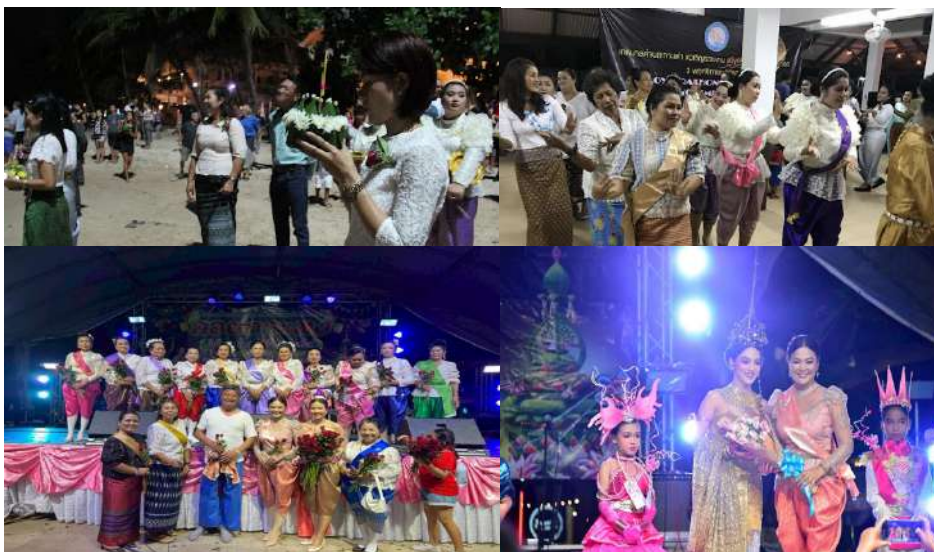
(ภาพการเข้าร่วมกิจกรรมประเพณีลอยกระทงในพื้นที่เกาะเต่า)

ประเพณีลอยกระทงจัดขึ้นเป็นประจำทุกปี (ช่วงเดือนพฤศจิกายน) ที่ท่าเรือแม่หาด เน้นการอนุรักษ์สิ่งแวดล้อมและวิถีธรรมชาติ โดยมีกิจกรรมลอยกระทงที่ทำจากวัสดุธรรมชาติ และแสดงบนเวที โดยทั่วไป เกาะเต่าเป็นตัวอย่างที่ดีของการท่องเที่ยวเชิงอนุรักษ์และลอยกระทงเป็นงานใหญ่ที่ผู้คนรอคอยและเรายังเน้นความเป็นมิตรต่อสิ่งแวดล้อมและยั่งยืนในการจัดกิจกรรมกิจกรรมที่ทำ เช่น ประดิษฐ์และลอยกระทงจากวัสดุธรรมชาติ เช่น ใบจาก ,การแสดงบนเวทีและกิจกรรมวัฒนธรรม, การลอยกระทงเพื่อขอขมาพระแม่คงคาและสะเดาะเคราะห์