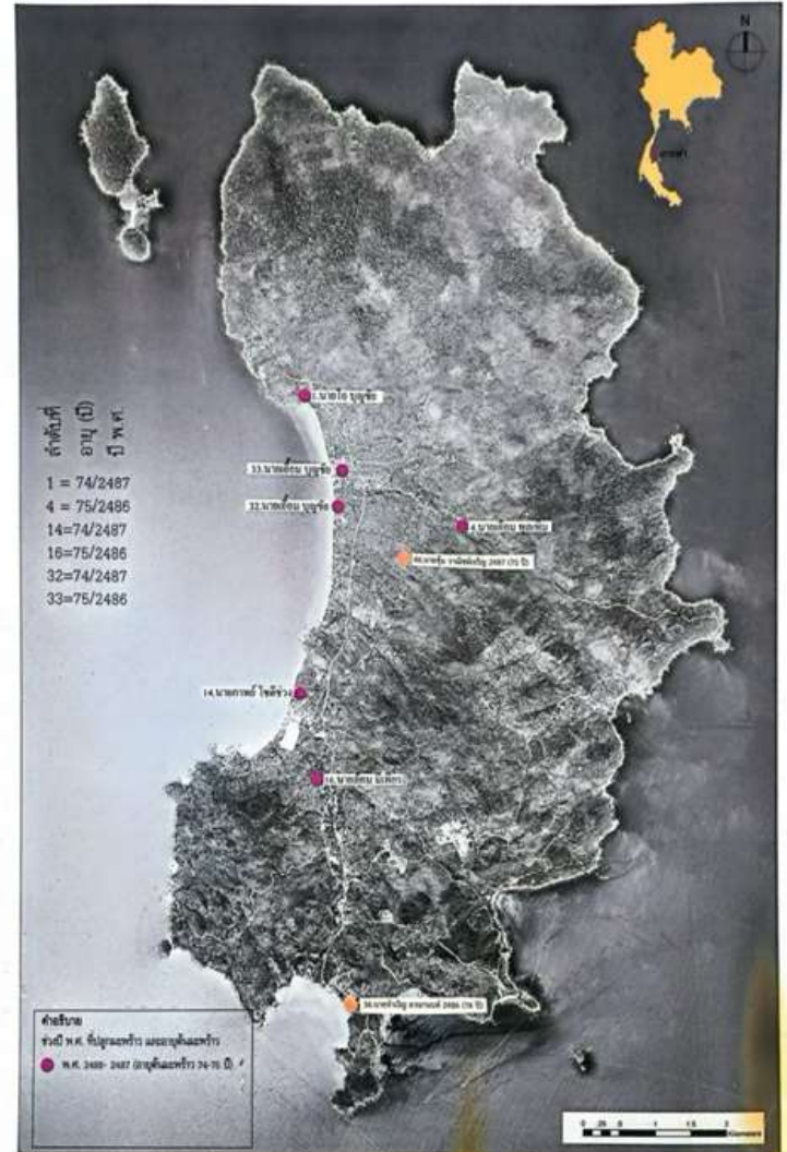
แผนที่แสดงอายุมะพร้าว พืชผลอาสินของราษฎร และเจ้าของสวนมะพร้าว ตำบลเกาะเต่า อำเภอเกาะพะงัน จังหวัดสุราษฎร์ธานี ระหว่างปี พ.ศ. 2486-2487

ที่มา แผนที่ความละเอียดสูงของศูนย์วิจัยข้าวสุราษฎร์ธานี กรมการข้าว/กรมส่งเสริมการเกษตร โดยอาศัยข้อมูลจาก สถาบันพันธุศาสตร์ International Plant Genetic Resources Institute (IPGRI), Food and Agriculture Organization of the United Nations (FAO) และ COGENT, กรุงเทพฯ ปี 2551 บันทึกโดยสำนักงานโครงการวิจัยศูนย์วิจัยข้าวสุราษฎร์ธานี กรมการข้าว/กรมส่งเสริมการเกษตร แผนที่ภาพถ่ายดาวเทียม พ.ศ. 1938 กรมแผนที่ทหาร