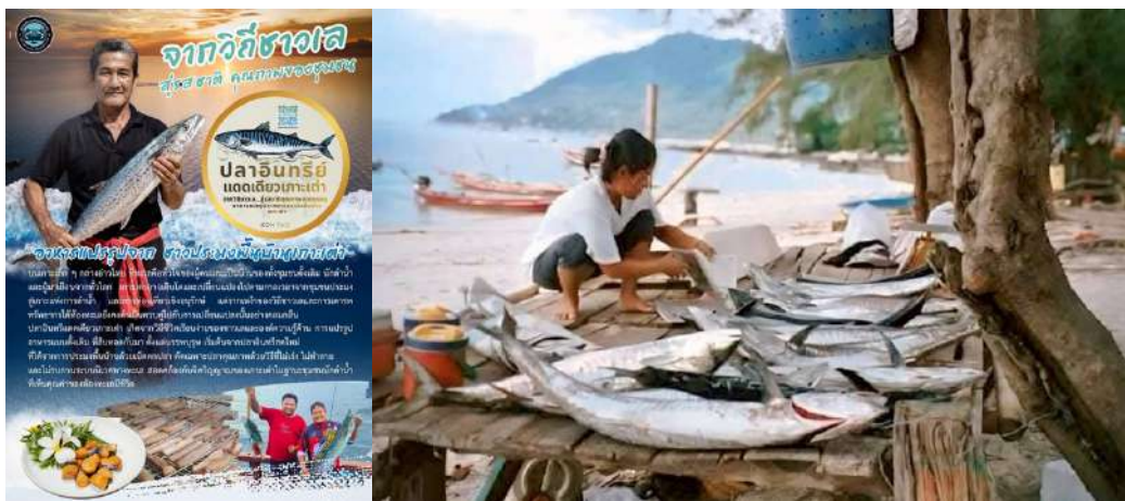
(ภาพอาชีพประมงพื้นบ้านและผลิตภัณฑ์แปรรูปปลาหวาน ปลาแตเดียว)

บนเกาะเต่าเรามีกลุ่มแม่บ้านประมงพื้นบ้านที่ได้มีการแปรรูปอาหารทะเล เช่น ปลาอินทรียัดแตเดียว และปลาหวาน เพื่อสร้างรายได้เสริมนอกเหนือจากการออกเรือ โดยเน้นความสะอาด ปลอดภัย และแสดงให้เห็นถึงแหล่งที่มาของวัตถุดิบที่จับมาอย่างยั่งยืน นอกจากนี้ยังมีอาหารสูตรเด็ดที่หาทานยาก เช่น “ดอกเห็ดปลา” “ข้าวมันกะทิกับน้ำพริกมุ้งมุ้ง” ที่เป็นเมนูเฉพาะถิ่นของพื้นที่ เป็นต้น