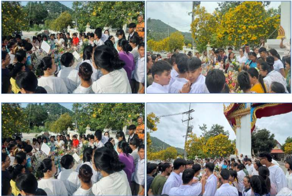
(ภาพประเพณี “ชิงเปรต”)