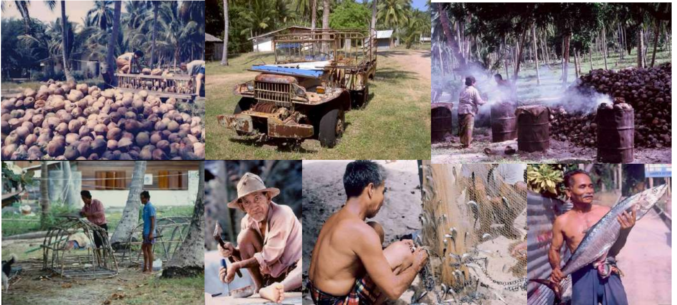
(ภาพอาชีพทำสวนมะพร้าวและอาชีพประมงพื้นบ้านบนเกาะเต่า)

อาชีพประมงพื้นบ้าน และอาชีพทำสวนมะพร้าว ที่มีการทำมะพร้าวแห้งขาย และการใช้เตาอย่างมะพร้าว เป็นต้น เรามีจัดแสดงอุปกรณ์ประมงพื้นบ้าน และเครื่องมือทำสวนมะพร้าว เพื่อให้คนรุ่นหลังเห็นว่า กว่าจะเป็นเกาะเต่าในวันนี้ บรรพบุรุษเราฝ่าฟันมาด้วยอาชีพและเครื่องมือต่างๆเหล่านี้เอง