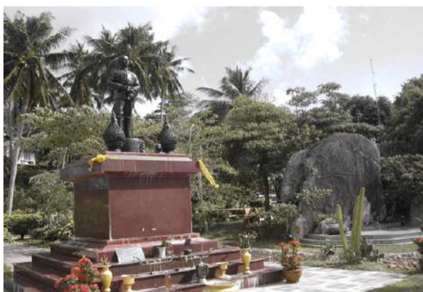
(ภาพพระบรมราชานุสาวรีย์ขององค์พระบาทสมเด็จพระจุลจอมเกล้าเจ้าอยู่หัว ที่ตั้งประดิษฐานคู่กับแผ่นศิลาพระปรมาภิไธยย่อ "จ.ป.ร.")