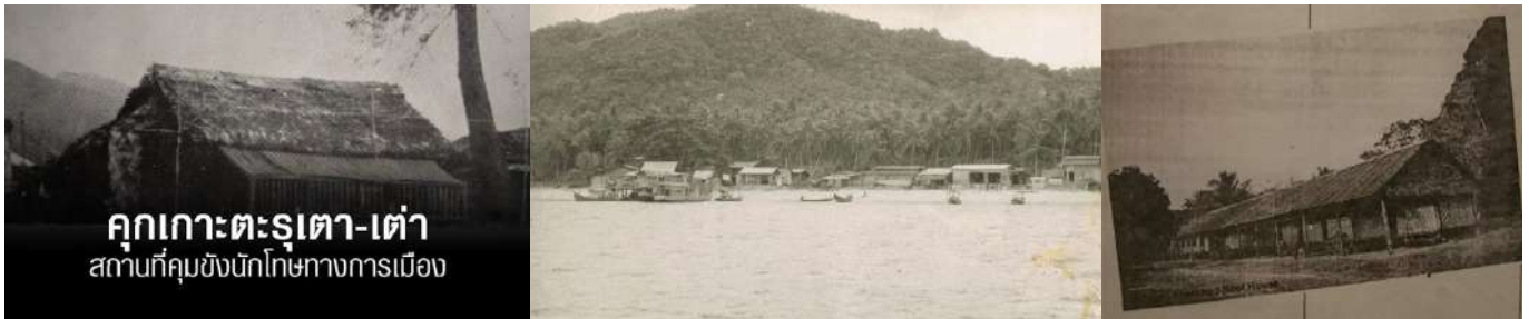
(ภาพตำนานคุกเก่าที่เชื่อมโยงกับเหตุการณ์กบฏบวรเดช ที่เคยใช้คุมขังนักโทษ)

ซากกำแพงคุกเก่าที่เชื่อมโยงกับเหตุการณ์กบฏบวรเดช ไม่ใช่กำแพงคุกบนเกาะเต่าโดยตรง แต่เป็นคุกตะรุเตา ที่เคยใช้คุมขังนักโทษการเมืองในช่วงปี พ.ศ. ๒๔๘๖ (๑๙๔๓) ก่อนย้ายนักโทษการเมืองมาที่เกาะเต่า ซึ่งปัจจุบันคุกตะรุเตาถูกยกเลิกแล้ว และเหลือเพียงร่องรอยทางประวัติศาสตร์และเรื่องราวของ "โจรสลัดตะรุเตา" ส่วนพื้นที่เกาะเต่าก็มีประวัติเป็นที่ตั้งของเรือนจำที่เคยใช้คุมขัง แต่สิ่งปลูกสร้างเดิมอาจไม่หลงเหลืออยู่มากนักในฐานะ "กำแพงคุก" ที่เห็นชัดเจนแบบตะรุเตา