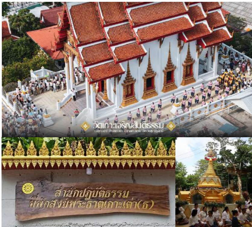
(ภาพสำนักปฏิบัติธรรม ที่พักสงฆ์พระธาตุเกะเต่า และวัดเกะเจริยสันติธรรม(วัดเกะเต่า))

ตั้งอยู่ที่บ้านหาดทรายรี และวัดเกะเต่าตั้งอยู่ที่บ้านแม่หาด ซึ่งเป็นหนึ่งในจุดสำคัญทางประวัติศาสตร์ของเกาะ และเป็นที่ยินยมนักท่องเที่ยวชาวบนเกาะเต่า เป็นสถานที่สงบสำหรับสักการะและปฏิบัติธรรม ที่นี่เป็นที่ประดิษฐานพระธาตุของพ่อแม่ครูอาจารย์หลายองค์ รวมถึงมีรูปหล่อหลวงปู่มั่นและหลวงตามหาบัว เพื่อให้ประชาชนได้กราบไหว้เพื่อเป็นสิริมงคล