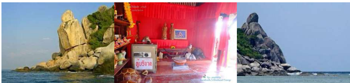
(ภาพศาลพ่อตาโต๊ะ แม่ยายเมะ ริมถนนสายแม่หาด-โศลกบ้านเก่า)

ศาลพ่อตาโต๊ะแม่ยายเมะ (หรือที่ชาวบ้านเรียกว่า หินตาโต๊ะ และ หินยายเมะ) ตั้งอยู่ที่ปลายแหลมทางทิศตะวันออกของอ่าวโศลกบ้านเก่า พ่อตาโต๊ะ แม่ยายเมะ เป็นตำนานของคู่สามีภรรยาเชื้อสายอิสลามที่เชื่อว่ามีตัวตนจริงบนเกาะ และเป็นที่เคารพของชาวบ้าน โดยเฉพาะ แม่ยายเมะ เป็นหมอดำแยที่เก่งกาจ ทำให้คนมาขอพรเรื่องการคลอดบุตร และผู้คนบนเกาะมักนำประทัดมาแก้บน